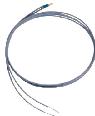
PTC 120 /160